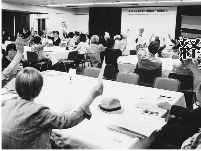
第67回通常総代会で議案に賛成する総代