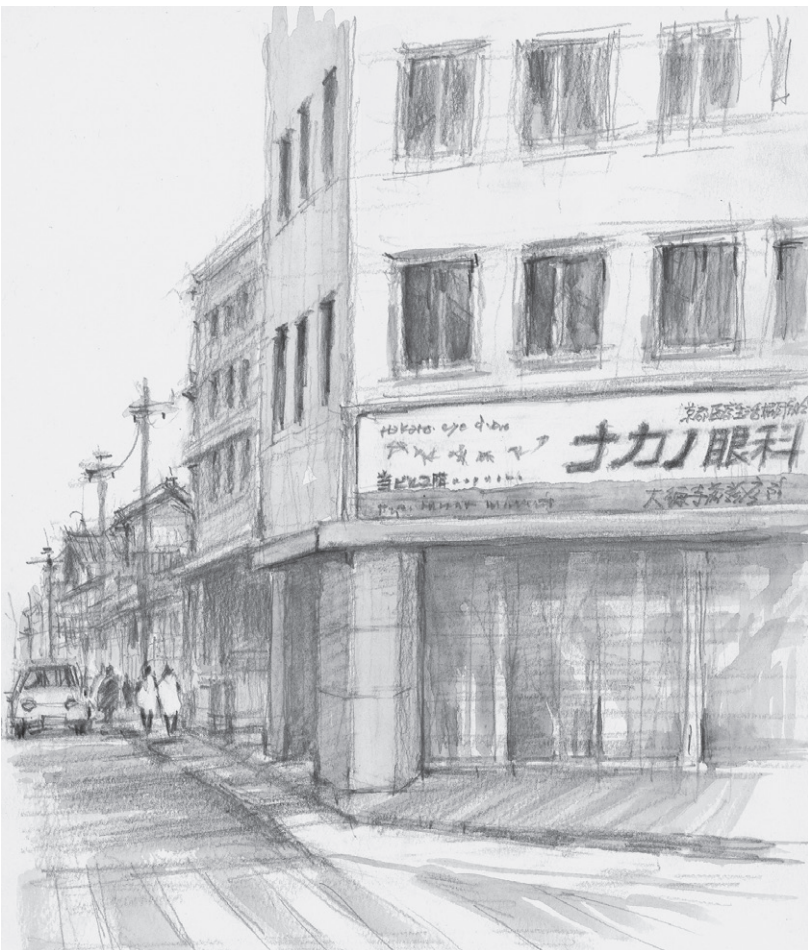
2周年を迎えた中野眼科 大徳寺前診療所 (駐車場2台整備。北大路大宮西南角)