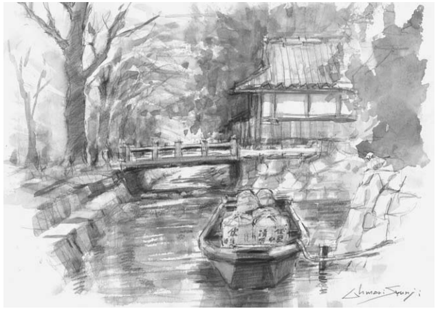
診療所のある街角で⑦ 一之船入

二〇一四年六月の開院から今日までの大徳寺前診療所の経営・運営状況を総括し、この間の総代会でのご意見、あるいは監事監査での指摘を踏まえて、理事会で繰り返し協議してきました。その中で医療生協・中野