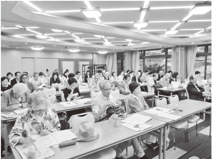
第71回通常総代会の会場風景