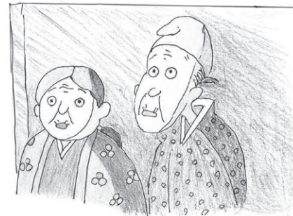
(総代Aさんからいただきました)